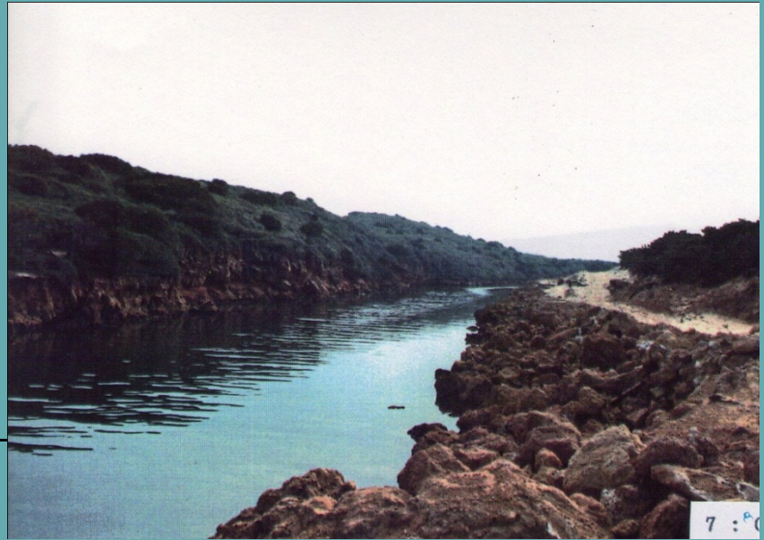
7 : 60