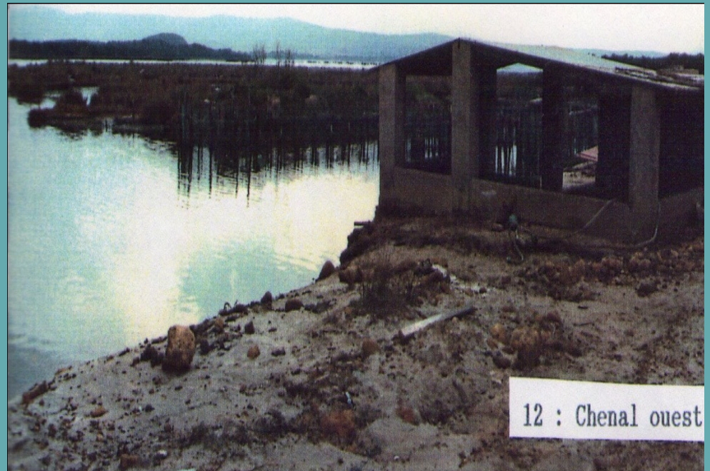
12 : Chenal ouest