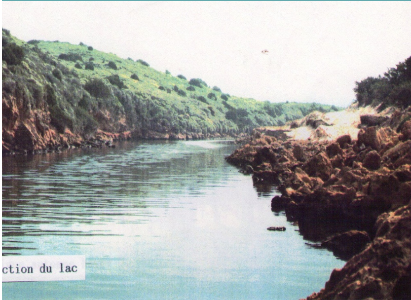
ction du lac